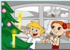
Ігри з вогнем