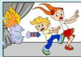
Фєсверки в приміщеннях