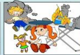
Залишені увімкненими електроприлади