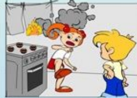
Неправильне користування газом та електроплитами